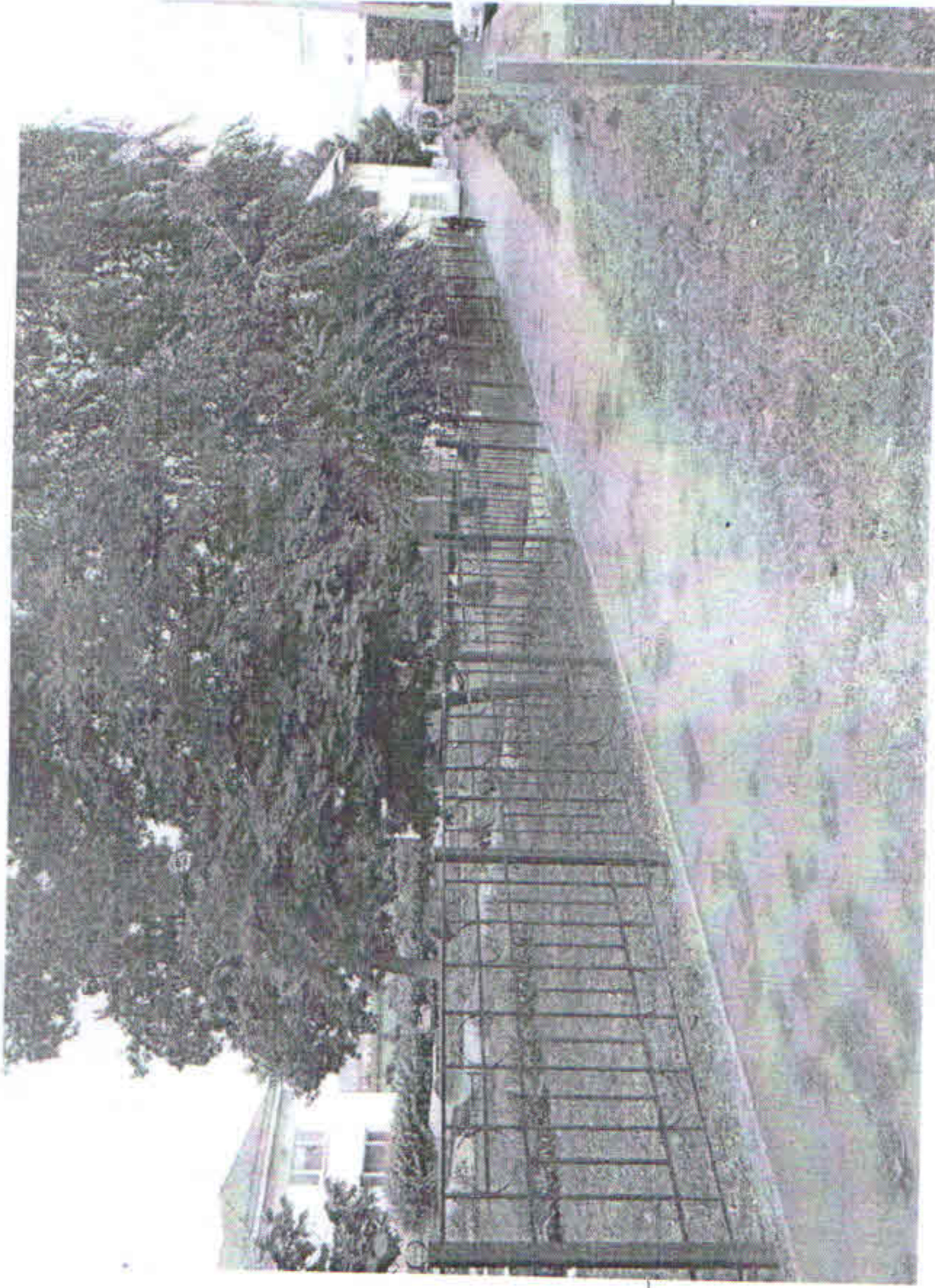
Фото на странице: 0